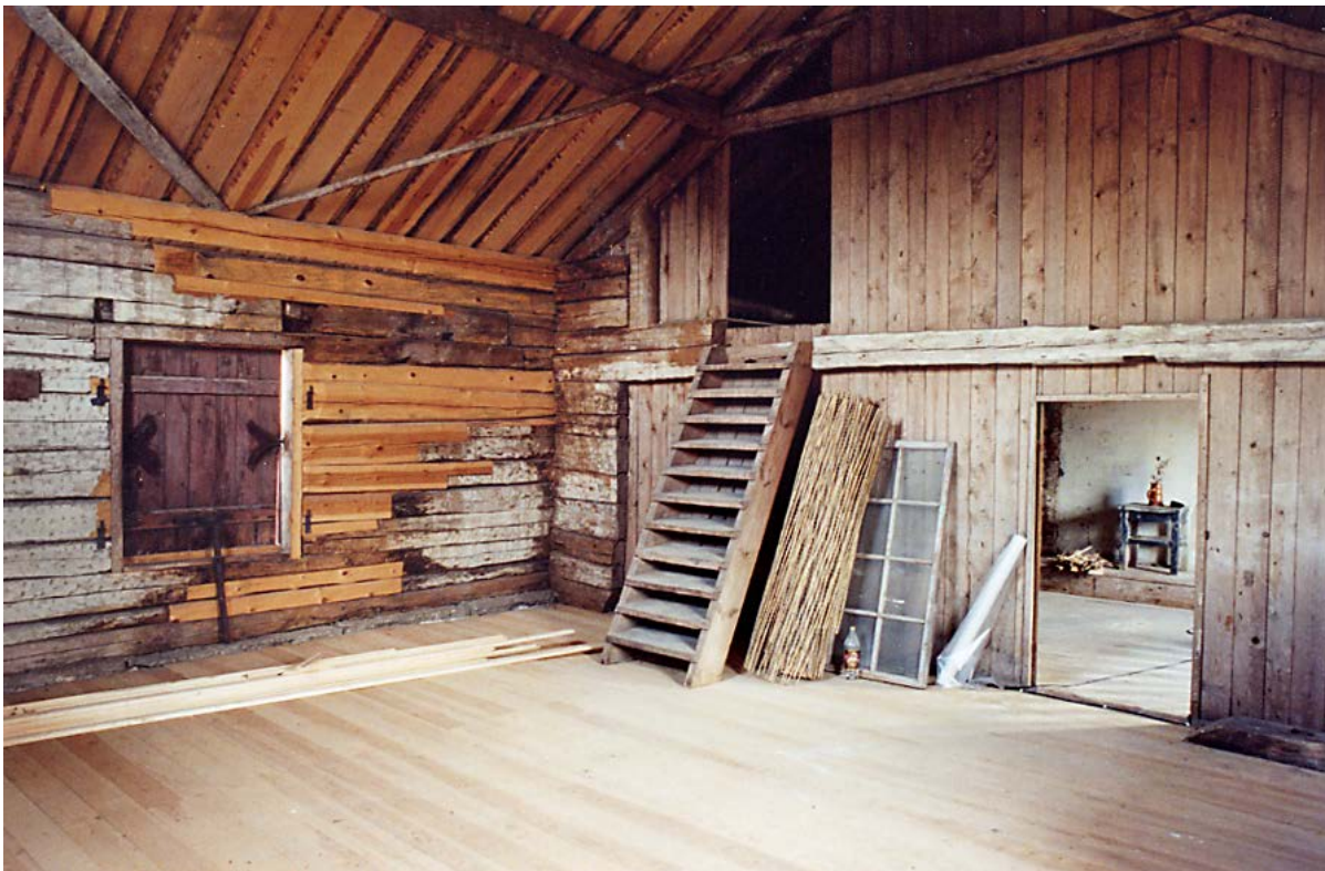
Magasinsrummet med det nya golvet som lades in hösten 2005. Okt. -06.