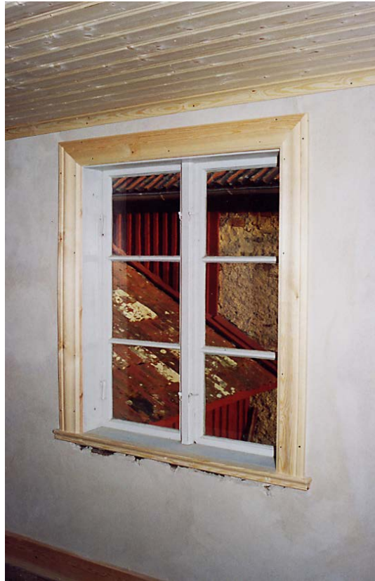
Vänster: Mattias Forsberg monterar nytt tak av pärlspånt i köket. Lasse Dahlberg övervakar. Okt. -06. Höger: Kökets yttervägg kalkputsades och fönsterfoder monterades. Nov. -06.